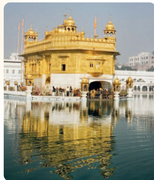
Harmandir Sahib

Wir bewegen uns vorrangig auf den Hochalmen der dort ansässigen hinduistisch geprägten „Gaddi“ Schafhirten, die der eigentliche Grund für das Bestehen dieses Wegesystems in der sonst wenig zugänglichen Region sind. Wiesen, Wälder, winzige Dörfer und kleine Bachläufe zieren das Gesamtbild und die Wege. Kleine Brücken, die von den Einheimischen liebevoll instand gehalten werden, säumen unsere Pfade für die nächsten