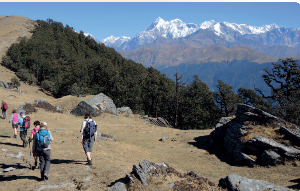
McLeod Ganj Trekking

Begegnungen mit Menschen verschiedenster Couleur: Sikhs, buddhistische Mönche, den Bergvölkern und den weltweit bekannten Exiltibetern um deren Oberhaupt, den Dalai Lama in Dharamsala.