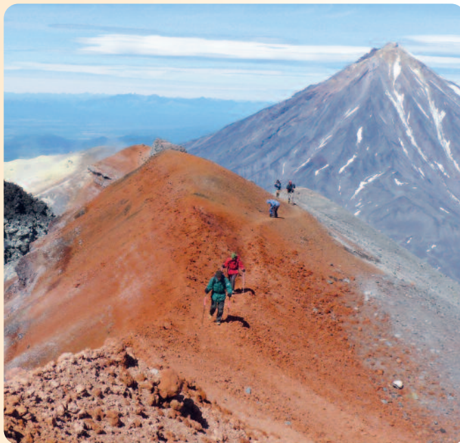
Vulkanlandschaften auf dem Avatcha, im Hintergrund der Vulkan Korjakski

DER NORDEN: EWENEN, ITELMENEN - TOLBACHIK & KLYUCHEVSKAJA 6 Tage Die Giganten Kamtschatkas: Der Anblick der höchsten aktiven Vulkane Eurasiens, des 4835 m hohen Klyuchevskaja und seiner umgebenden "Eis-Nachbarn", wäre die Reise alleine wert! Eine mit Gletschern durchzogene Vulkankette ungeheuerlichen Ausmaßes in der nahezu menschenleeren Wildnis.