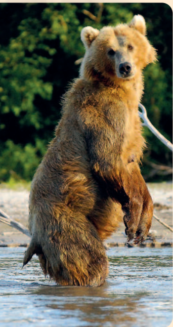
Bären in Kamtschatka

In die Wunderwelt der Geysire, Calderas und heißen Quellen - zu Gletschern und Tierparadiesen entlang endloser Vulkan- & Gebirgsketten und einsamer Küsten.