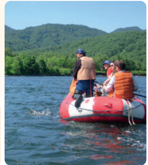
Flusswanderung auf der Bystraja durch unerschlossenes Land

Einen herrlichen Kontrast zu dieser Mondlandschaft liefert uns eine ausgedehnte Wanderung in