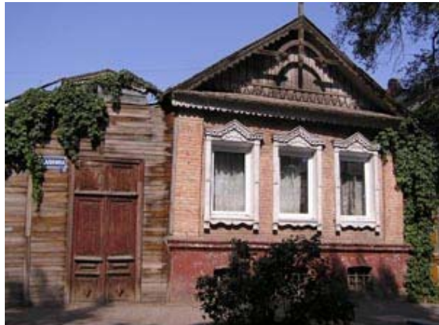
Museums-Haus in Astrachan