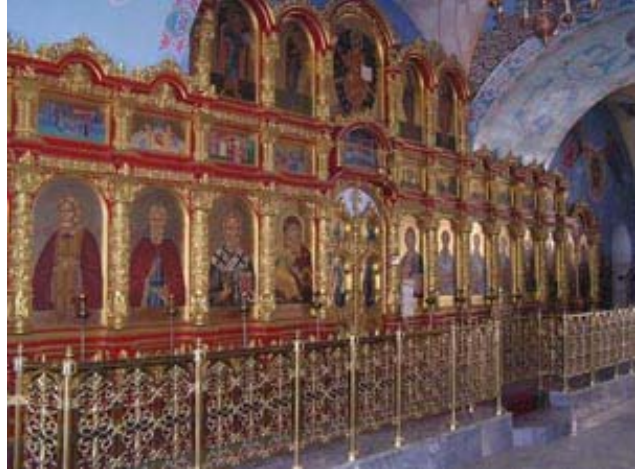
Der Kreml von Astrachan

7. Tag. Heute erwartet Sie ein Ausflug in die stille und weite Landschaft des Wolga-Deltas. Das Wolga-Delta ist ein Gebiet der einzigartigen Schönheit in der unberührten Natur. Viele Wolga-Abzweigungen, Inseln, Meeresbuchten und Sanddünen schaffen eine märchenhafte Landschaft. Die mächtige Wolga teilt sich hier in mehrere kleine Arme und bildet einen echten Wasserdschungel aus mehr als achthundert Kanälen. Hier gibt es viele Vogelarten: Schwäne, Pelikane, Enten, Kormorane und Reiher. Sie können solche seltene Vögel wie Rosa-Flamingo, Krauskopf-Pelikan und Seeadler sehen wie auch die Lotusfelder - die größten der Welt. Picknick in der Natur. Rückkehr nach Astrachan.