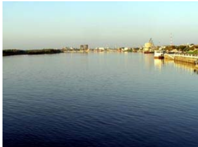
Wolga bei Astrachan