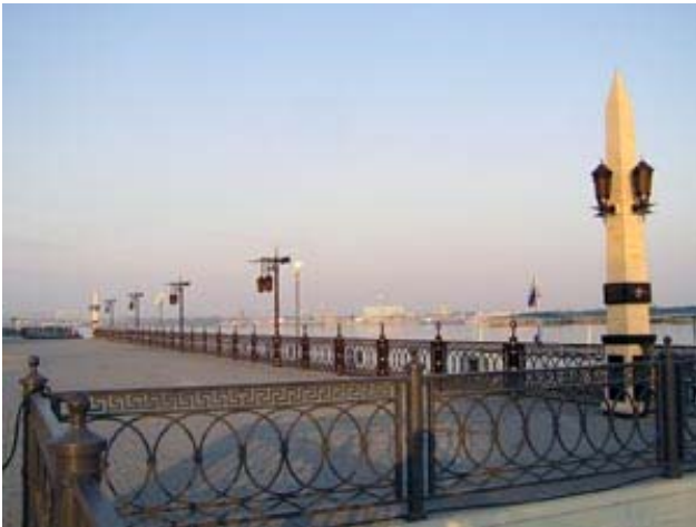
An der Mole in Astrachan