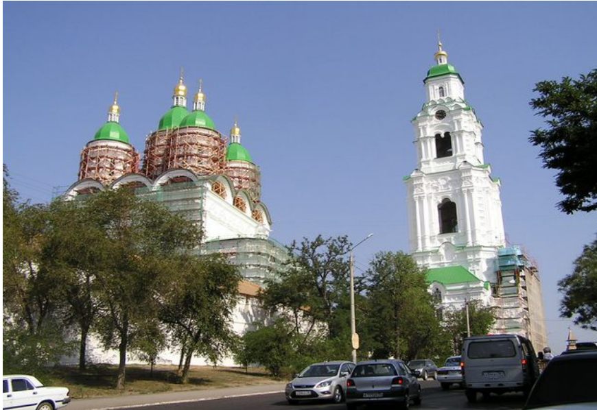
Kreml von Astrachan

6. Tag: Astrachan. Einst ein Tataren-Khanat, das erst im 16. Jahrhundert von Iwan dem Schrecklichen erobert wurde, gewann Astrachan später für den Handel mit dem Orient an Bedeutung. Heute ist es das Zentrum der russischen Kaviar-Produktion. Während einer Rundfahrt lernen Sie die Stadt genauer kennen. Fakultativ können Sie einen Ausflug in die Wolga-Delta buchen (Bezahlung vor Ort).