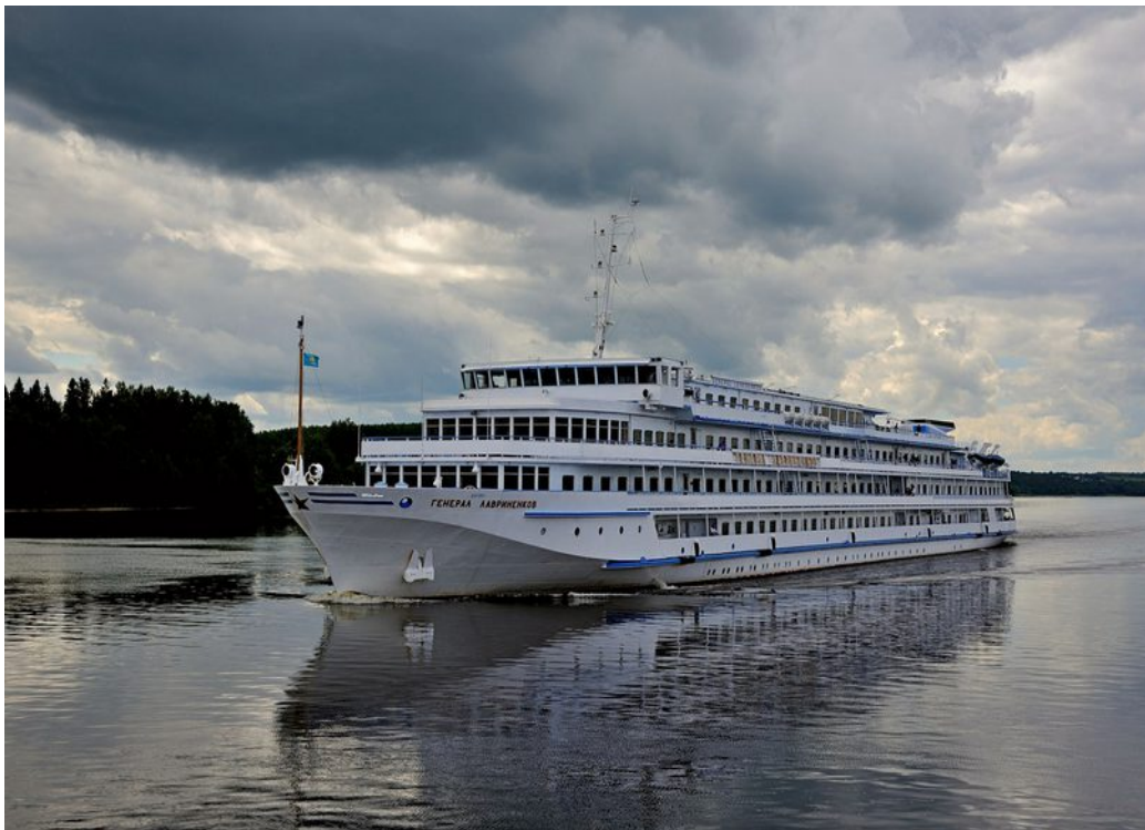
das Motorschiff MS Lavrinenkov

(Änderungen des Reiseverlaufs vorbehalten!)