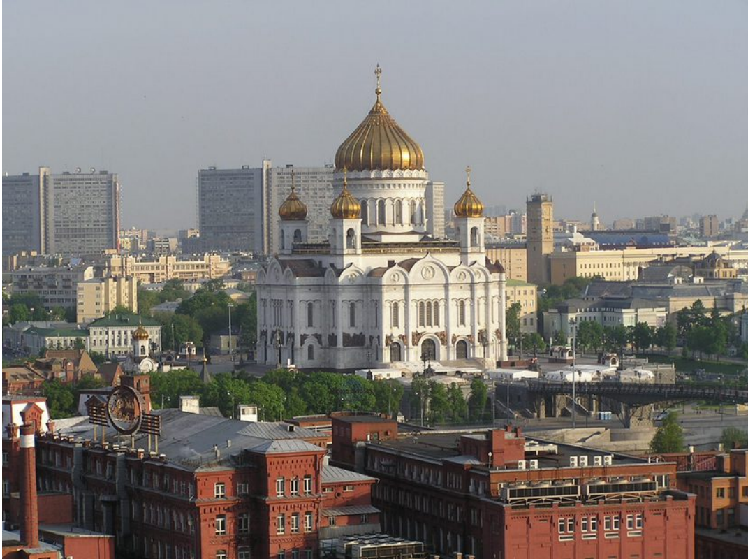
Erlöserkirche in Moskau

19. Tag: Moskau - Rückreise. Heute werden Sie zum Flughafen gebracht, wo Sie Ihre Heimreise antreten. Bis zur nächsten Reise!